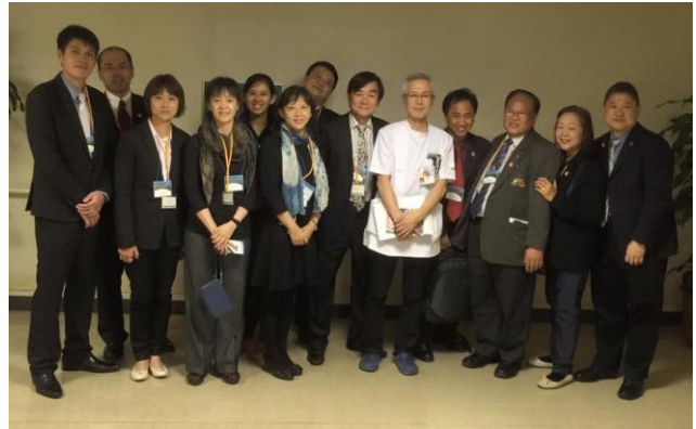
圖 6：參觀京都大學附設醫院