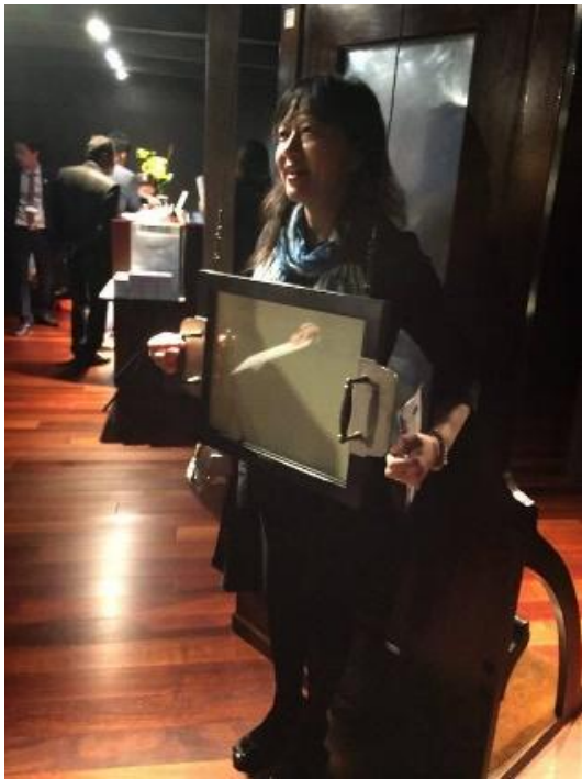
圖 7：參觀島津博物館