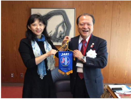
圖 5：與日本會長合影