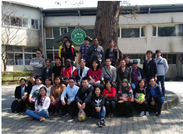
圖 6: 復興活動中心合影