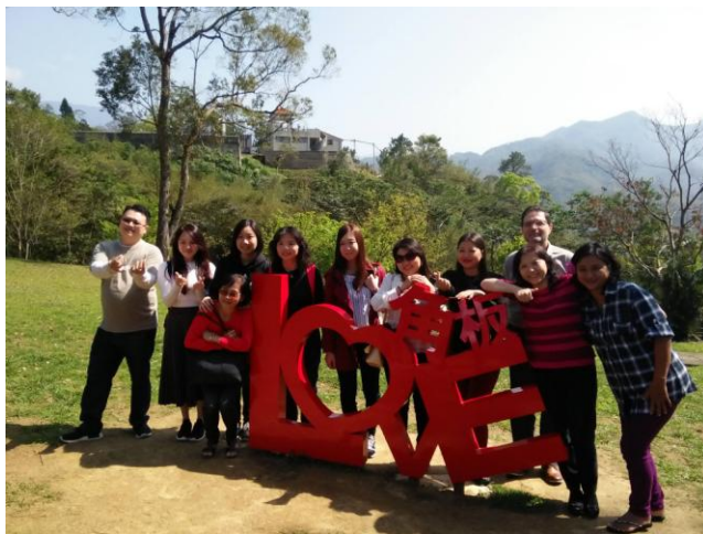
圖 8: 角板山公園