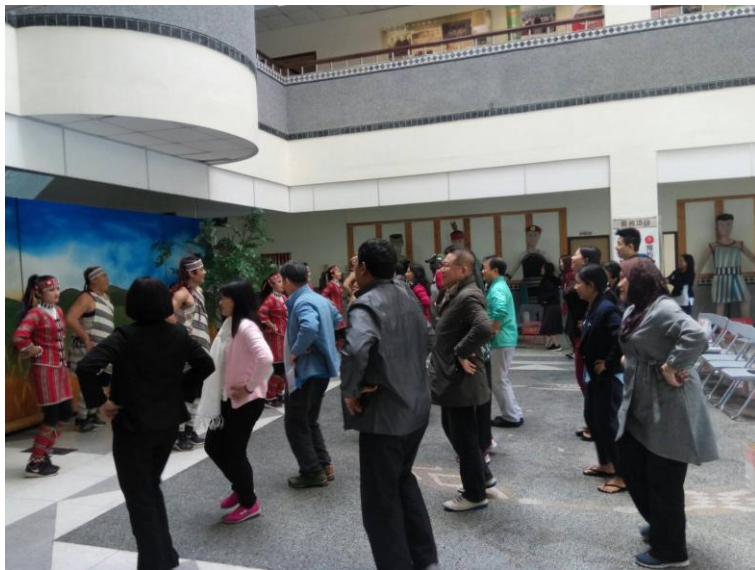
圖 3: 與原住民一同舞蹈