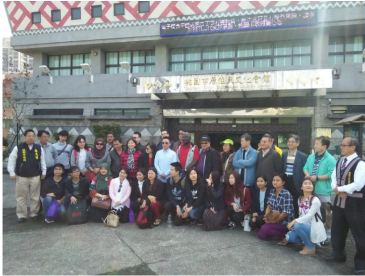
圖 1: 參觀原住民文化會館