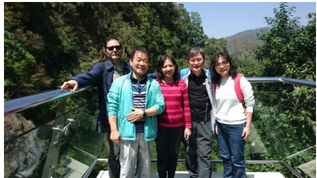
圖 5: 與希臘與韓國外賓合影