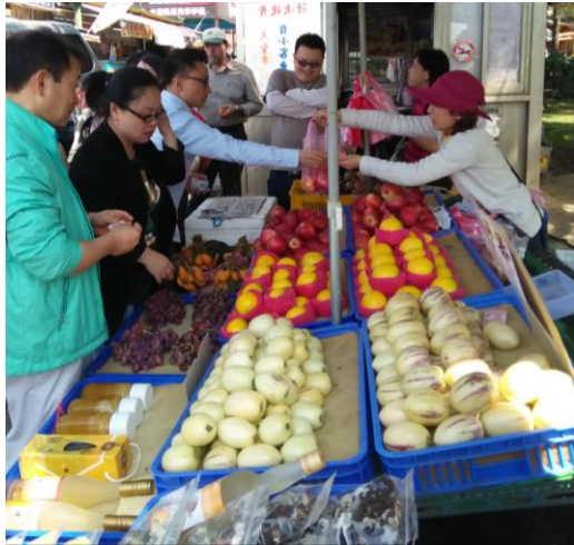
圖 4: 韓國、澳門、泰國外賓紛紛購買水果