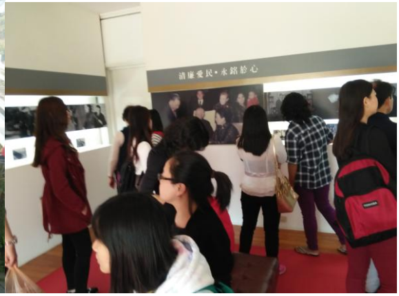
圖 10: 參觀蔣公行館