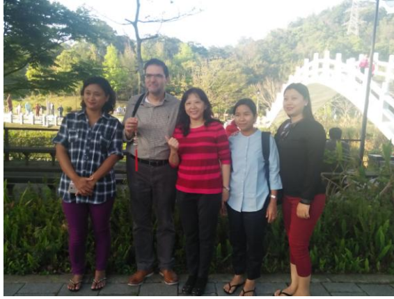
圖 9: 與希臘及緬甸外賓合影