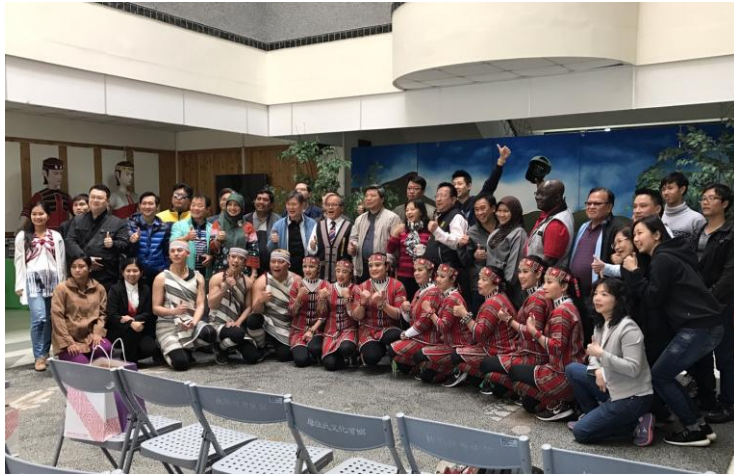
圖 2: 與原住民舞蹈團合影