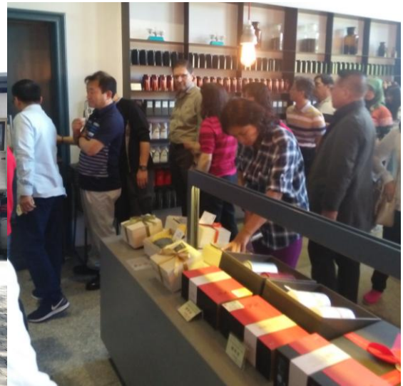
圖 7: 大溪製茶場